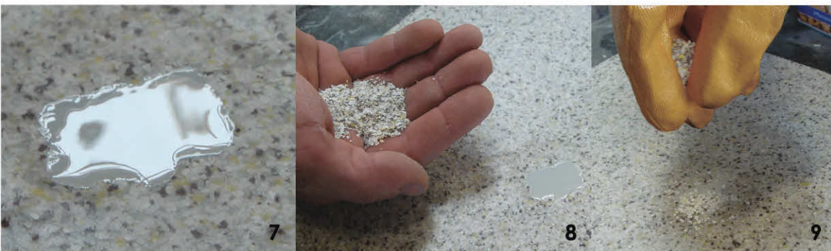
7 - Fertig aufgetragenes Gemisch 8 - Farbchips ( C ) 9 - Die Farbchips auf das noch feuchte Harzgemisch aufstreuen. Nun das Ganze ca. 45 min aushärten lassen.