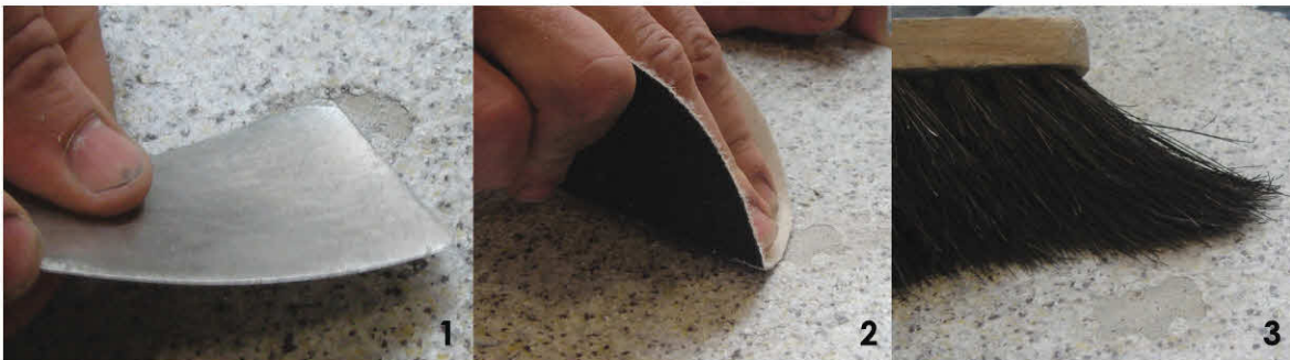
1 - Zuerst die lose angrenzenden Ränder der vorhandenen Beschichtung mit einem Spachtel entfernen. 2 - Dann die Stelle mit Schleifpapier abschleifen. 3 - Die Stelle mit einem Handfeger vom Staub befreien.

Vor Beginn der Reparatur ist darauf zu achten, dass die Oberfläche der Mineralit - Balkonbodenplatte trocken ist. Nur wenn dieser Sachverhalt gegeben ist, kann mit der Reparatur begonnen werden. Bitte beachten Sie die Sicherheitshinweise!