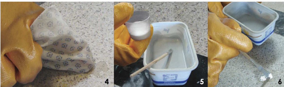
4 - Reinigung mit Aceton 5 - Anrühren des Harzgemisches. Das grau eingefärbte Harz ( A ) mit ca. 1,5 % Härterpulver ( B ) mischen und gut verrühren. 6 - Das Gemisch mit einem Pinsel auf die Stelle auftragen.